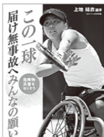
※平成30年度の推進標語(ポスター)