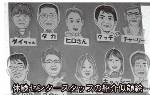
体験センタースタッフの紹介似顔絵

今回の熟議では「子どもたちに郷土学習を通して、町の自慢できるところ、町の誇れるところを説明できるコミュニケーション能力を身に付けさせたい」という意見が出ていました。