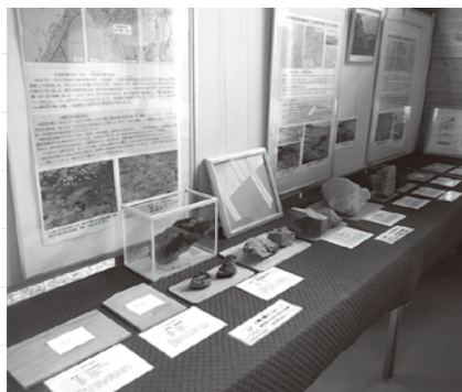
岩石や化石など約80点の標本を新たに展示しました。

9月にぶなつこランド森林科学館に展示物を追加しました。これまでは、「秋田県の大地」や「白神山地」について学ぶコーナーはありましたが、「八峰町の大地」に特化した展示はありませんでした。そのため、今回の展示では八峰町独自の大地のストーリーに焦点を当て、白神山地関連の他の拠点施設との差別化を図りました。また、最新の情報を随時更新していくために、展示は簡単に更新可能なものに仕上げています。