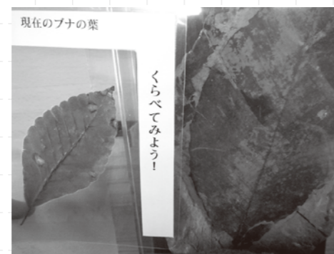
化石からは当時の堆積環境を調べることが出来ます。

以前八峰町で採掘されていた石炭などの鉱物資源についても、図と写真を交えながら分かりやすく解説しています。また、標本はただ眺めるだけでなく、触って学べる展示を目指しました。