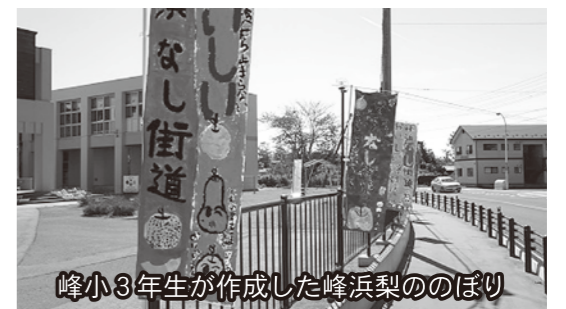
峰小3年生が作成した峰浜梨ののぼり

さて、大人のみなさんは『町の自慢できるところ、誇れるところ』を言えますか。子どもは大人の鏡なので、大人が口に出して言わないと子どもたちもなかなか言えませんよ。ちなみに私は、「峰浜梨、ハタハタ、おいしい水、海川山のある風景、釣りができる砂浜・岩浜、夕日、体験センタースタッフの笑顔、〇〇協会のあの人、〇〇会社の彼、若手の〇〇など…」あー、ありすぎてここにおさまらない！