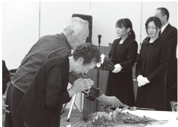
恒久平和を誓いました

遺族会では高齢化が進み、戦没者の子の世代は70代後半が多数となりました。戦争を経験していない世代が多くなった今の時代において戦争の悲惨さや平和の尊さを後世に伝えることの大切さを再確認し、恒久平和を誓う式となりました。