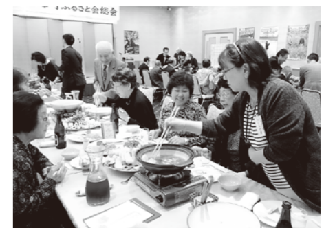
きりたんぼ鍋に舌鼓を打つ参加者

暑かった夏も過ぎ、あちこちにススキがみられ、また「ななかまど」の実も赤く色づいて、北海道は早くも初秋を迎える季節となり、年に一度八峰町出身者が集まり、「どしてらが?」「んん、元気だ。このごろパークゴルフやてるもの!」なんて、それぞれの秋田弁による近況報告が聞かれる「北海道八峰町ふるさと会」が今年も近づいて参りました。