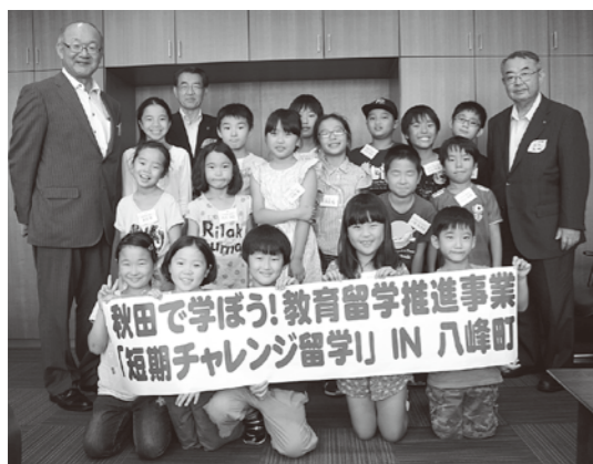
町長室に元気なあいさつが響きました

首都圏を中心に小学校2～6年生までの県外児童17名が参加し、磯遊びや留山散策などの自然体験を満喫したほか、峰浜小学校で「秋田の探求型授業」を体験しました。昨年に引き続き参加した児童もおり、「新しい友達ができ、八峰町のことも知れて楽しい。」と教育留学を満喫しているようでした。