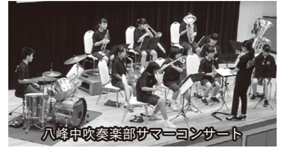
八峰中吹奏楽部サマーコンサート