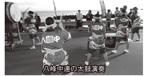
八峰中連の太鼓演奏

8月25日『八峰中吹奏楽部サマーコンサート』は、11名の部員で頑張りました。「音楽で地域に元気を届けたい」との部長のあいさつに胸がジーンとなりました。 そのほか、地域行事や郷土芸能に参加している中学生もいました。 当コミュニティ・スクールでは、地域と家庭と学校が連携してみんなが元気になることを目指します。大人たちも頑張りました。