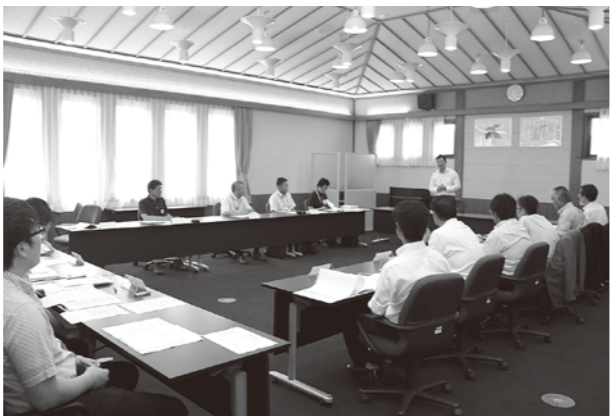
委員から様々な意見が出されました

8月20日、役場大会議室で八峰町総合戦略検証委員会が行われました。この委員会は、平成27年に町で策定した「まち・ひと・しごと創生総合戦略」についての取組みや成果を検証する場となっています。同戦略は、人口減少を抑制し、将来にわたって活力ある町の創生を町民と行政が一体となって取り組むことを目的として策定されました。検証委員会ではこれまでの主な取組みと今後の取組みについて議論され、様々な意見が出ました。検証委員会の詳しい内容や達成数値等については次号以降の広報はっほうで特集します。