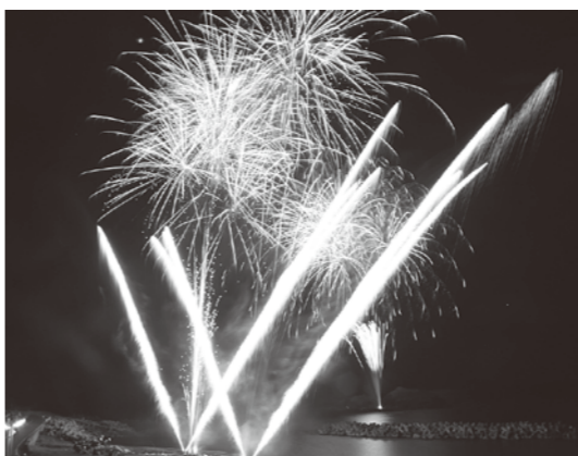
目の前から打ちあがる光のショーは迫力満点

8月18日、第32回雄島花火大会が中浜海岸で開催されました。「子供に夢を」「誇れる郷土を」「地域に活力を」のスローガンを掲げ、雄島花火実行委員会（諸沢英紀委員長）が主催している同花火大会は、今年で32回目を迎えました。今年15日に行う予定でしたが、天候不良のため18日に延期されました。当日は、肌寒い気温だったものの、家族連れなど多くの観覧客が訪れました。オープニングセレモニーでは、八峰中生と「祭鼓連」による太鼓の競演が行われ、会場を盛り上げました。約1時間の打ち上げでは、海上花火や迫力ある10号玉などが美しく海面を照らしました。