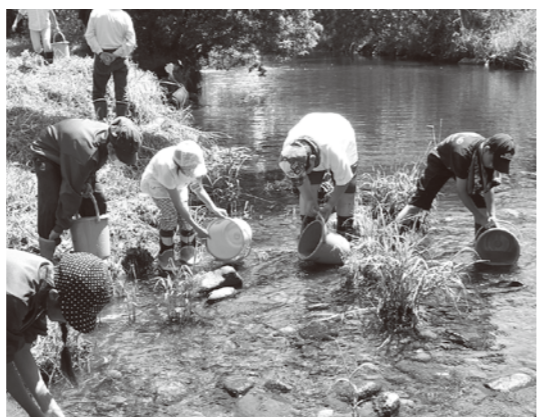
優しく川に放流しました

6月4日、峰浜小の5年生が目名湯地区の水沢橋のたもとの水沢川で、アユの稚魚の放流を行いました。