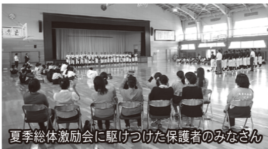
夏季総体激励会に駆けつけた保護者のみなさん

6月に全県の地域コーディネーターとコミュニティ・スクール関係者の会議があり、各市町村から約80名が集まりました。要は学校と家庭と地域の連携に関わっている人たちの会議です。小グループでの話し合いの中で「学校の敷居が高く感じる」「学校や地域で何を望んでいるかわからない」「学校統合で地域とのつながりが薄くなった」など本音の話が出ていました。