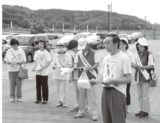
「幸福の黄色い羽根」が目印です

この運動は、「犯罪や非行を防止し、立ち直りを支える地域のチカラ」をキヤッチフレーズに推進され、7月15日にはハタハタ館前で街頭キャンペーンを実施する予定です。