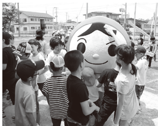
「人権まもる君」が登場し大人気でした