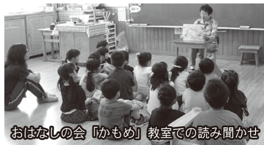
おはなしの会「かもめ」教室での読み聞かせ

「学校の敷居が高く感じる」というのは私も少し感じます。学校に用事があるときは「エイッヤ」と気合を入れてから行きます。学校のみならず官公庁もたいがいそうですよね。でもね、学校の先生方はとても親切で丁寧です。慣れれば大丈夫ですよ。また行きたくなくなるかもしれません。今日の教育問題は学校だけにとどまらず、家庭や地域の力が必要とされていますので、何かあるときは「エイッヤ」と出かけましょう。