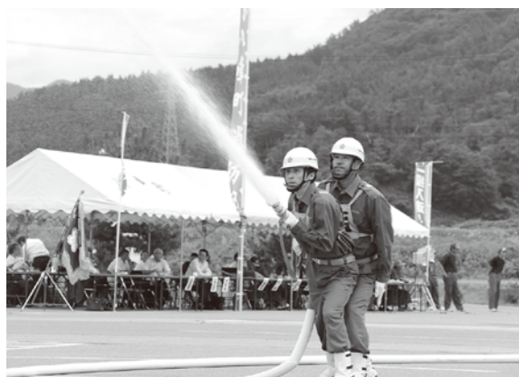
機敏な動きを披露しました