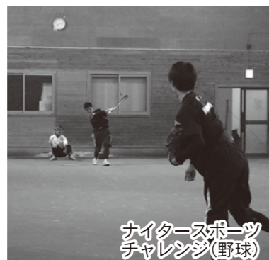
ナイタースポーツ チャレンジ(野球)