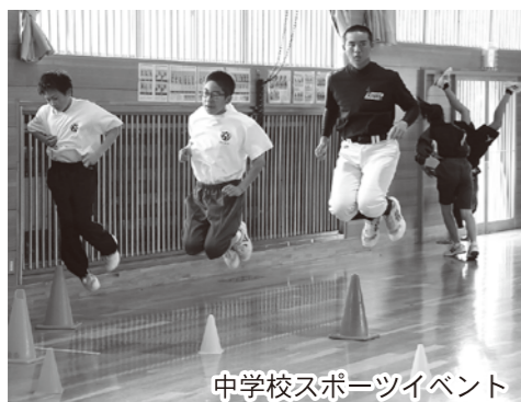
中学校スポーツイベント

5月30日、全国121の自治体に参加するスポーツイベント「チャレンジデー2018」が開催され、今年5回目の参加となる八峰町は、鹿児島県和泊町と対戦し、目標としていた「参加率70%」を超え、71・9%の参加率で4年連続金メダルを獲得するとともに、和泊町に勝利しました。