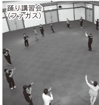
踊り講習会 (フデガス)