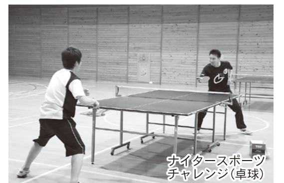
ナイタースポーツ チャレンジ(卓球)