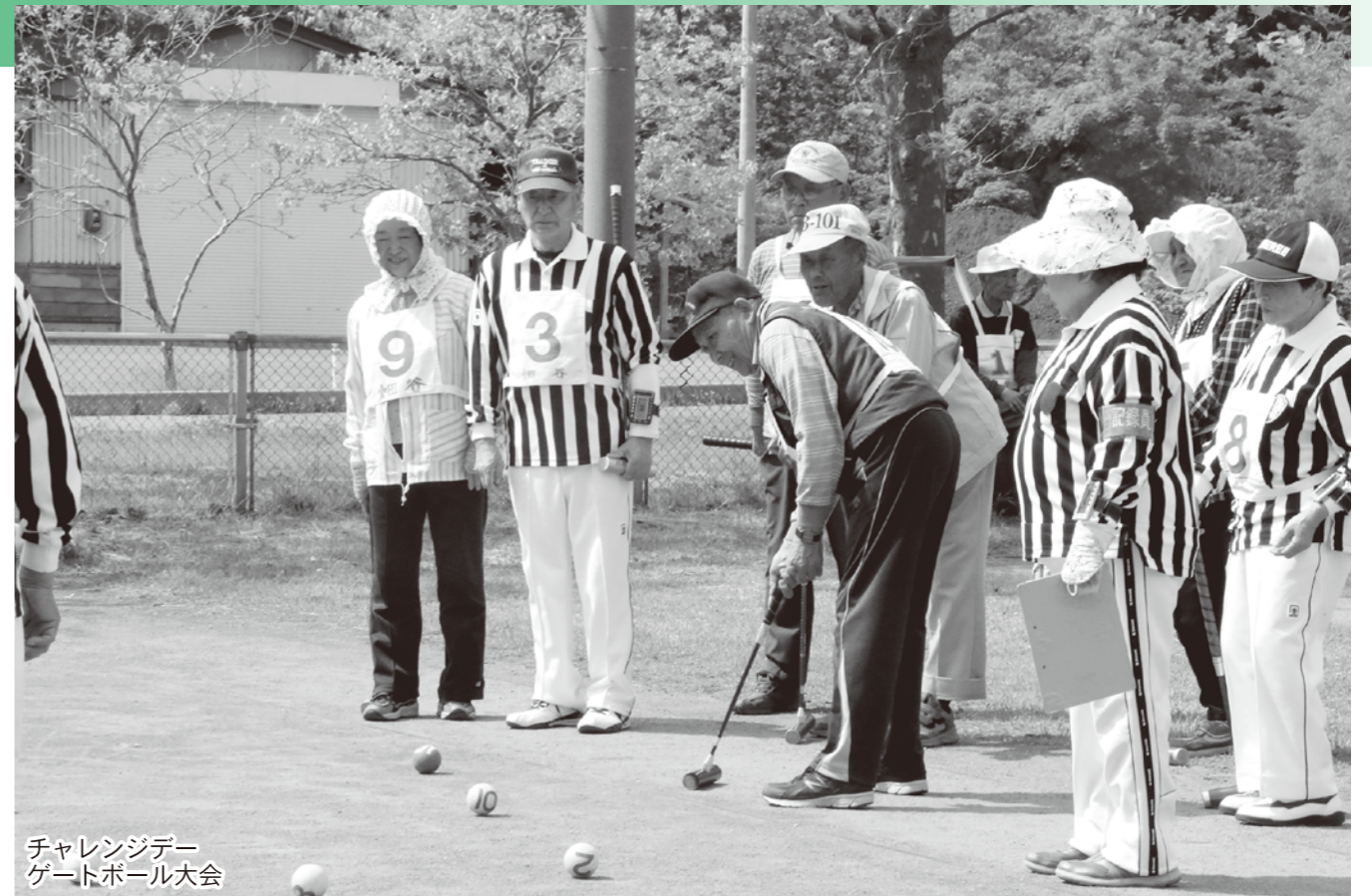
チャレンジデー ゲートボール大会