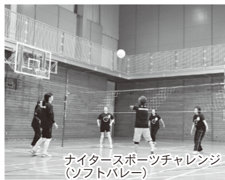
ナイタースポーツチャレンジ (ソフトバレー)