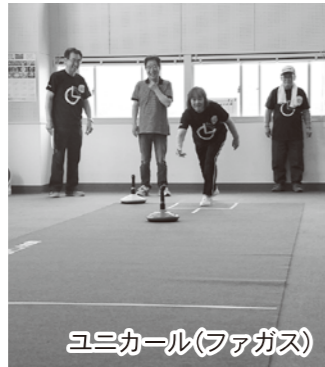
ユニカール(ファガス)