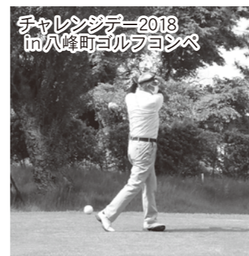
チャレンジデー2018 in八峰町ゴルフコンペ