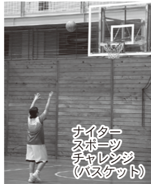
ナイター スポーツ チャレンジ (バスケット)