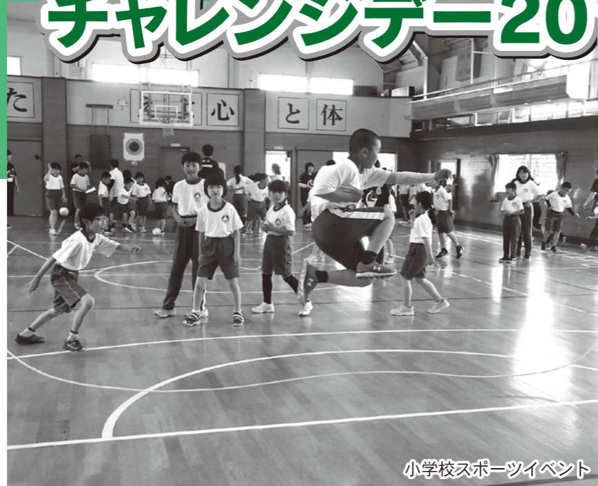
小学校スポーツイベント