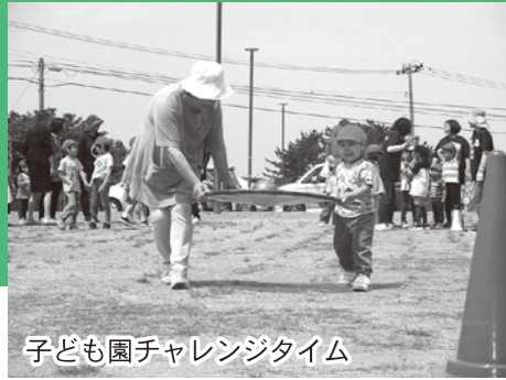
子ども園チャレンジタイム