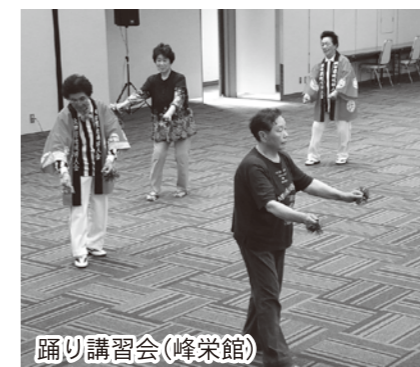
踊り講習会(峰栄館)