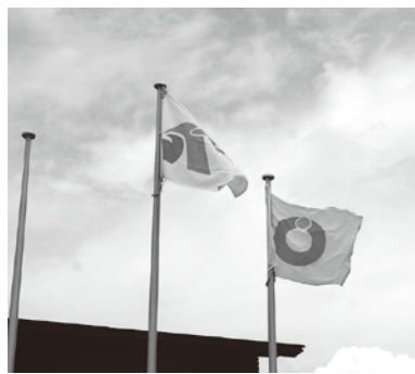
お互いの町旗掲揚

や買物など身体を動かした住民の『参加率』を競います。本町では様々なイベントを用意して取り組みました。当日は天候にも恵まれ、朝早くから多くの町民の方々が運動を行い、昨年を約2・5ポイント上回る事ができました。小中学校や自治会、町内企業などが積極的に運動を行ったおかげで今年度も金メダル(参加率61%以上)を獲得できました。ありがとうございます。今後も日常的に運動し、健康づくりに励みましょう。 今回勝利したことで、和泊町役場のメインポールに八峰町の旗が掲揚されました。八峰町役場でも和泊町の旗を掲揚し、お互いの健闘を称えました。