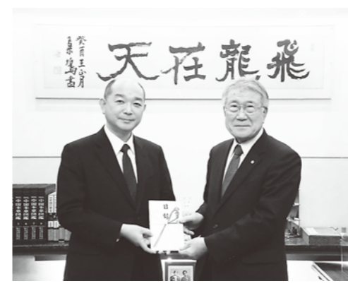
温かいご配慮ありがとうございます

今回の寄附金で、町ではトラクターや掘取機・皮むき機・冷蔵庫などを購入し、より安定した生薬の栽培ができるよう、整備をする予定です。生薬の産地拡大、担い手の掘り起こしにつながることを期待しています。