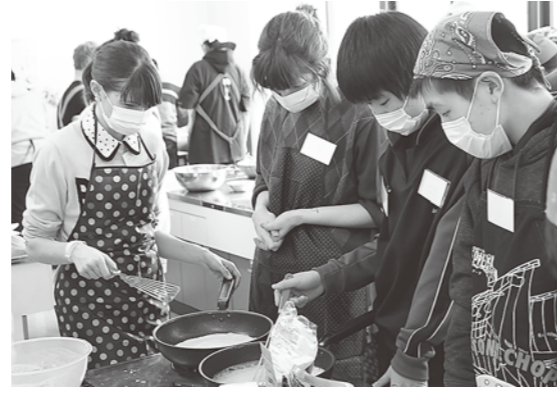
留学生と協力して作りました

3月3日、「外国のランチを楽しもう」と題して、国際教養大学の留学生との交流事業が峰栄館で行われました。