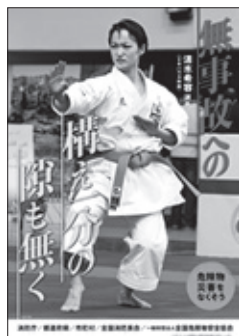
※令和元年度の推進標語（ポスター）