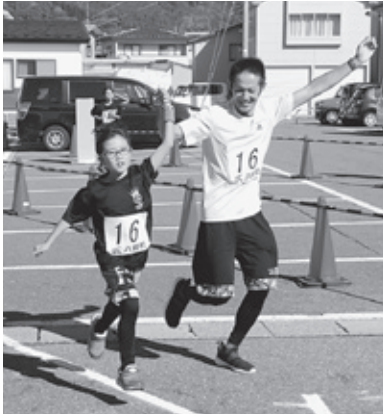
手をつないでゴール!