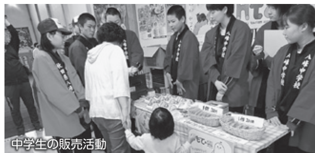
中学生の販売活動