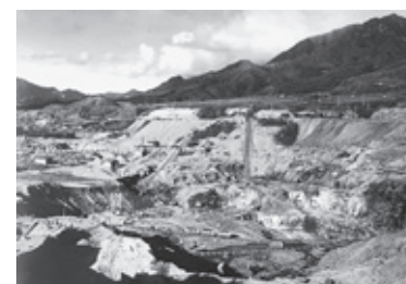
↑ 当時の露天掘りの様子