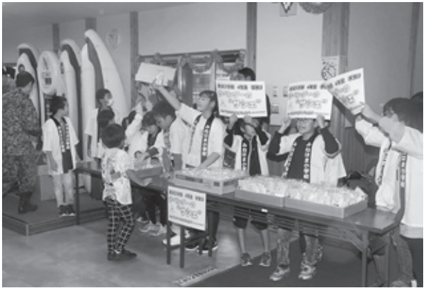
大きな声で商品の宣伝をしました