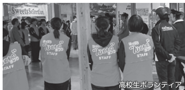
高校生ボランティア