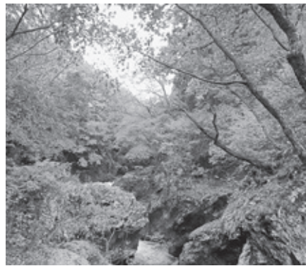
今年も町内各所で紅葉が見られました

今年の夏は例年になくぐらぐらと曇り、残暑も長く続きました。その影響か、秋らしい気候になるのも遅く、紅葉も一週間から10日ほど後ろにずれている印象です。