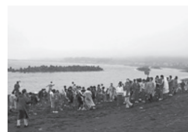
↑ ブラックサンドビーチ

現在、発盛鉱業所が露天掘りをした跡地は、中央公園になっており、鉱業所の歴史を伝える場所として、43メートルあった大煙突の10分の1サイズのモニュメントと説明看板が設置されています。