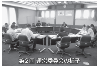
第2回 運営委員会の様子

その後、再認定審査の指摘事項に対するアクションプランについて話し合いました。例えば、八峰白神ジオパークはどんなジオパークなのかがわかるストーリーを決定する必要があります。そのため、今後ストーリー検討委員会を設置し、アドバイザーの指導のもと、自分たちの言葉で作成していきます。