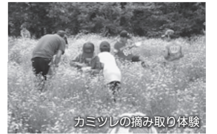
カミツリの摘み取り体験