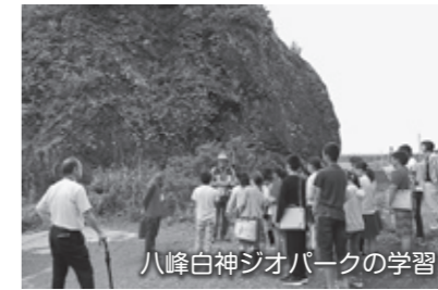
八峰白神ジオパークの学習