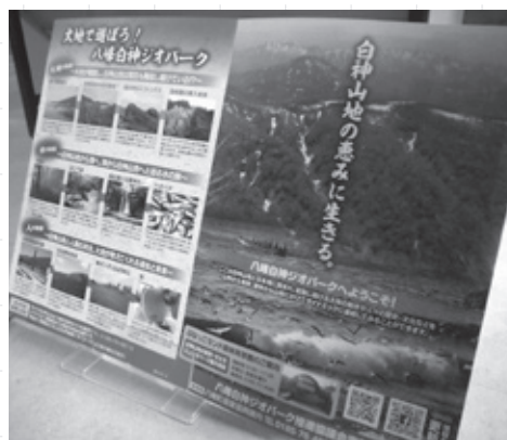
パンフレットの裏面はジオパークのマップです

当協議会ではジオサイトの変更や事務局の移転に伴い、3月に新しいパンフレットを作成しました。新しいパンフレットでは、「大地の物語」「水の物語」「人の物語」とジオサイト同士をストーリーで結び付けることで分かりやすく、興味を惹くような構成になっています。今後町の各施設に配置する予定です。パンフレットの提供をご希望の方は左記事務局までお気軽にご連絡ください。