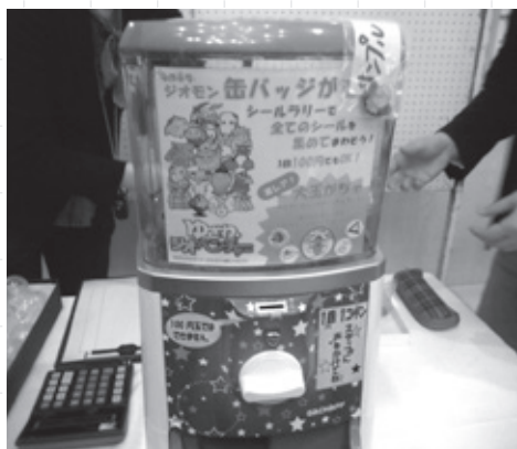
ガチャガチャではオリジナル缶バッジが景品でした

講演会では、司会がバスガイドを演じながら、ガイドがリレー形式で写真スライドを使って県内各ジオパークを案内しました。参加者はゆざわジオパーク