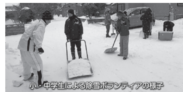
小・中学生による除雪ボランティアの様子