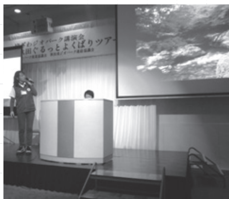
講師は実際に現地を案内するように出演しました

参加者のアンケートでは、「各地域のダイナミックな自然現象、姿が素晴らしかった」「実際に現地をすべて巡るのは大変なので、こういう機会をもっと作ってほしい」などの意見がありました。