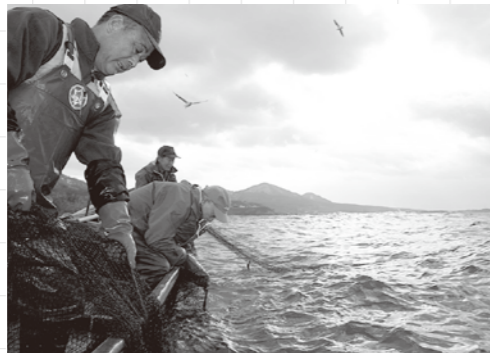
ハタハタ魚の様子

雷とともにやってくる魚「ハタハタ」 八峰町では、毎年12月の上旬あたりになると雷鳴とともにハタハタが接岸するようになります。ハタハタは八峰町民の生活に密着してきた魚で、「しよつづる鯛」や「はたはた寿司」などの伝統的な食文化を現代に伝えていきます。