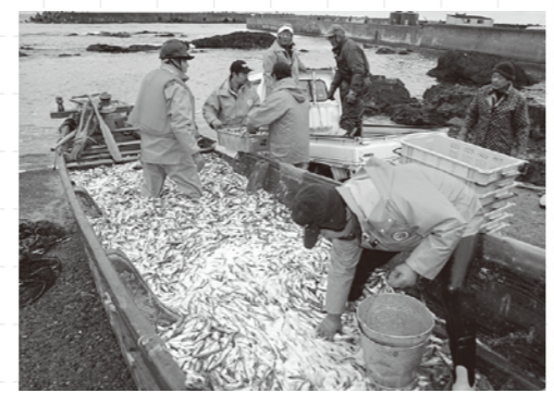
この時期は八峰町の漁港が大いに賑わいます

和歌・俳句では雷の季語は夏となっています。日本海沿岸の雷は、大陸から吹き出してきた冷たいシベリア気団が日本海の対馬海流によって暖められて発生する積乱雲によるものです。この積乱雲は白山神山地などの山に衝突し雷や雪を降らせ、太平洋側では乾燥した冷たい空気となります(左図)。