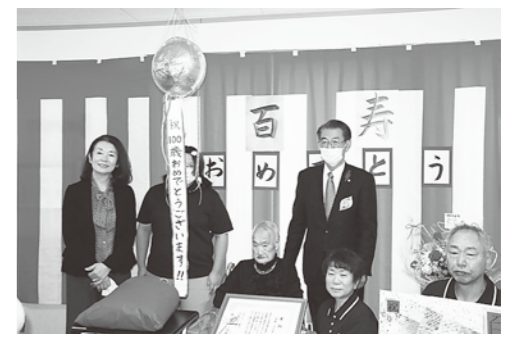
アイ子さんの100歳をお祝いしました