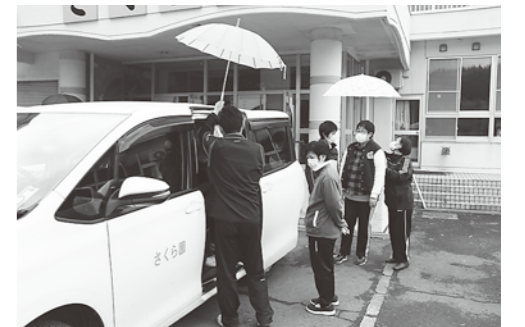
指定避難場所の役場へ避難する様子

避難勧告が発令された放送を合図に、さくら園の入所者と施設職員は、園の車両に乗りし指定避難場所である役場へ避難しました。