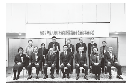
表彰者、贈呈者の集合写真

11月10日、峰栄館で令和2年度八峰町社会福祉協議会会長表彰等表彰式が行われました。今年は新型コロナウイルス感染症の影響で、例年行われている社会福祉大会が中止となり表彰式のみの実施となりました。