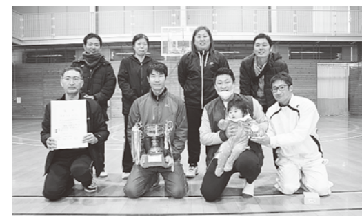
優勝した「茂浦・立石チーム」