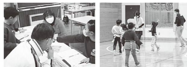
宿題をする峰浜小学校2年生 尻尾とりで遊ぶ八森小学校1年生

地域住民の方々と一緒に宿題を進めたり、鬼ごっこや尻尾とりなどのレクリエーションを行い、交流を深めました。