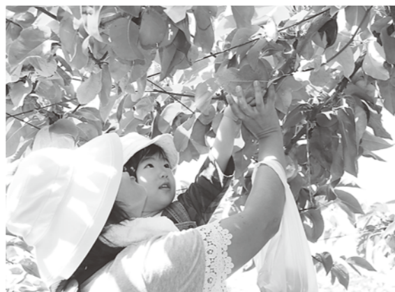
丁寧に梨を収穫しました

9月29日、カッチキ台地区の笠原果樹園で、子育て支援センター「あいあいよこひろば」の行事、またJA秋田やまもと食農体験教室の一環として、梨のもぎ取り体験が行われました。 この日は、子ども園入園前の子どもとその保護者5組が参加しました。梨の取り方の説明を受けた後、親子一緒に一番大きな梨を探しながら、楽しそうに収穫していました。 梨のもぎ取り体験終了後は、沢目神社の境内へ移動し、自由遊びを楽しみました。 子育て支援センターは、遊び、学び、経験、交流ができる施設です。お気軽にご利用ください。