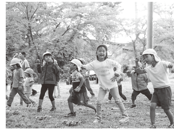
かわいらしいお遊戯を披露しました