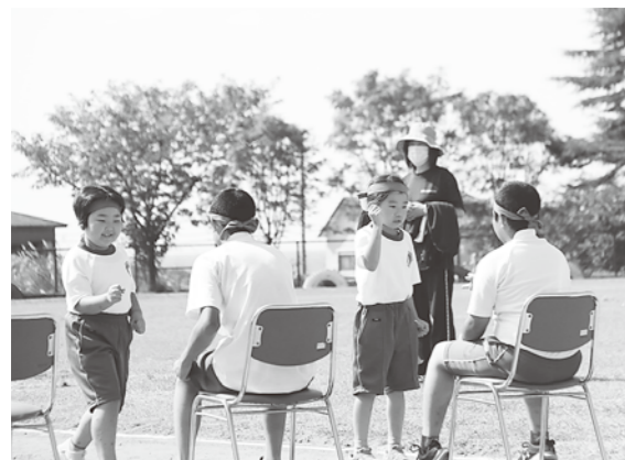
レク種目は大いに盛り上がりました

9月23日、八森小学校で、10月4日に峰浜小学校で秋の体育行事が行われました。 このうち八森小学校では、爽やかな秋晴れの下、各学年赤・青・黄の3つの組に分かれ、マラソン・リレー大会が行われました。 学年別のマラソンやじゃんけんを取り入れたレク種目、全校リレー、選手リレーが行われ、児童たちは一生懸命走ったり、仲間を応援を送ったりと大いに楽しんでいました。 平日の開催にも関わらず、会場には多くの保護者や地域の方などが集まり、児童たちの頑張っている姿に大きな拍手が送られました。