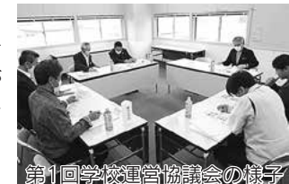
第1回学校運営協議会の様子

とあいさつがあり、出席した委員の士気が上がりました。 (と感じました) 新型コロナウイルスの影響で、今は子どもたちと地域の 交流にブレーキがかかっていますが、終息したら、また子 どもたちと地域のみなさんが 一緒になった笑顔が見たいで すね。がんばりましょう。