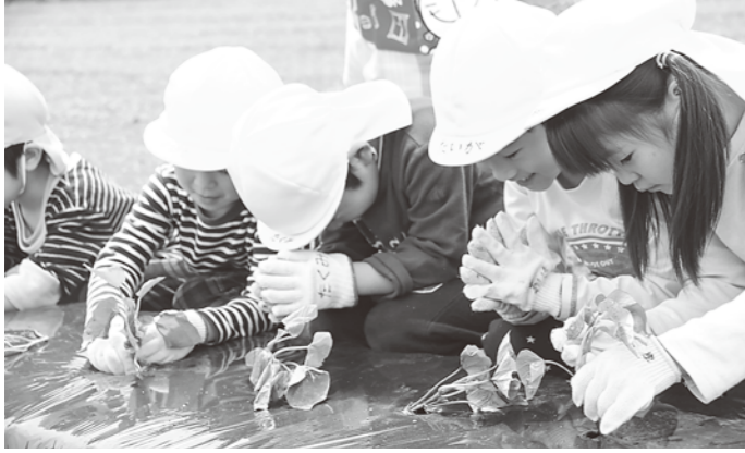
大きくなりますように

6月1日、田中地区のふれあい農園で沢目・埴川子ども園の園児たちが合同で、サツマイモの苗植えを体験しました。 園児たちは、役場の担当者から苗の植え方の説明を受けたあと、一列に並んで苗を植えました。苗植え体験の間、自分の植え方が合っているのかを聞いて、「大きくなあれ、大きくなあれ」と植えた苗の成長を願ったりする園児たちの姿が見られました。 秋には、自分たちで植えたサツマイモを収穫します。収穫が楽しみです。