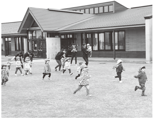
ゴール目指して一生懸命走りました

5月27日、八森子ども園でチャレンジデーが行われました。 新型コロナウイルス感染症拡大防止のため、今年のチャレンジデーは中止となりましたが、園児と職員のみで体を動かすことを目的に園独自で開催されました。 この日は、全員でラジオ体操を行い体をほぐしたあと、未満児は直線のコースをゴールを目指して走りました。また、以上児は園内に用意されたコースを駅伝形式で走りました。園児たちは、一生懸命走ったり、仲間を応援したりととても楽しそうでした。 駅伝終了後は、園長先生から頑張ったご褒美としてお菓子が配られ、もらった園児たちは嬉しそうなお様子でした。