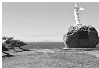
鎮魂のために設置された満安の乙女像・台座の石は地震により崩れてきたもの。重さ約60トンある。（現在は改修してコンクリート製）

・昭和58年（1983）5月26日、秋田青森県境沖の日本海で地震が発生し、死者・行方不明者104人におよぶ災害が生じました。この被害の大半が、津波によるものでした。地震の規模はマグニチュード7.7、震源の深さ14km、秋田青森県境沖100kmの地点でした。