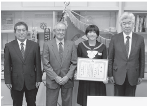
受賞おめでとうございます

11月9日、令和3年度八峰町社会福祉協議会会長表彰等表彰式が峰栄館で行われました。昨年引き続き、新型コロナウイルス感染症の影響で、例年行われていた社会福祉大会が中止となり表彰式の実施となりました。表彰式では、福祉団体等の役員・職員として功績が顕著な方、社会福祉活動を継続して行い、地域社会の模範となる方15名が表彰されました。また、社会福祉のための寄附をされた方2名に感謝状が贈呈されました。これまでの活動に敬意を表するとともに、今後も社会福祉の増進にご協力をお願いします。