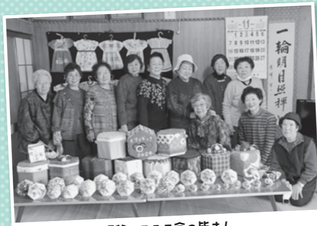
畑谷ニコニコ会の皆さん

この日は、1年を通して製作してきた折り紙などの作品を持ち寄り披露しました。趣味などの知識や経験を活かす機会でもあり今後も続けていきたいと話されました。