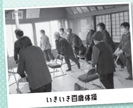
いきいき百歳体操