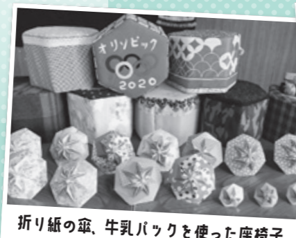
折り紙の傘、牛乳パックを使った座椅子