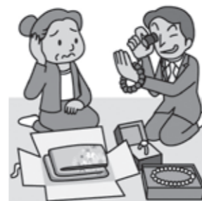
消費者庁 イラスト集より