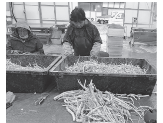
▲八峰産キキョウの根の選別作業の様子

キキョウ栽培では、育てる過程が結構簡単で手間もかからないので、空いた土地に植えることでちょっとしたおこづかいになります。みんなが少しずつ栽培することで八峰町がキキョウの一大産地になってほしいと思います。そして、キキョウが、キャベツ、ネギ以外の戦える農作物になればいいと思います。