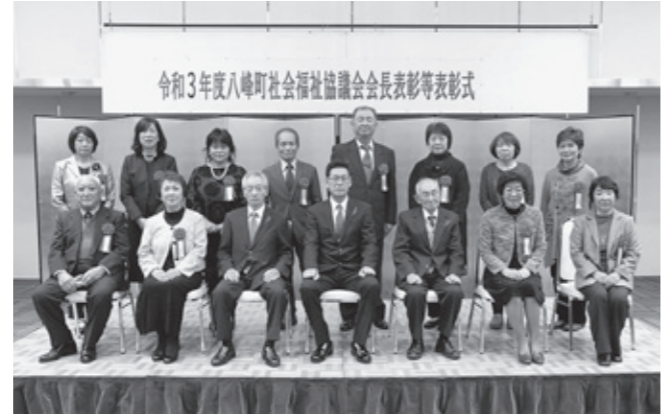
受賞されたみなさんおめでとうございます

11月9日、令和3年度八峰町社会福祉協議会会長表彰等表彰式が峰栄館で行われました。昨年引き続き、新型コロナウイルス感染症の影響で、例年行われていた社会福祉大会が中止となり表彰式の実施となりました。表彰式では、福祉団体等の役員・職員として功績が顕著な方、社会福祉活動を継続して行い、地域社会の模範となる方15名が表彰されました。また、社会福祉のための寄附をされた方2名に感謝状が贈呈されました。これまでの活動に敬意を表するとともに、今後も社会福祉の増進にご協力をお願いします。