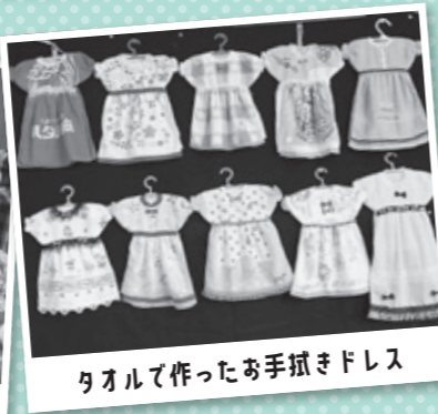
タオルで作ったお手拭きドレス