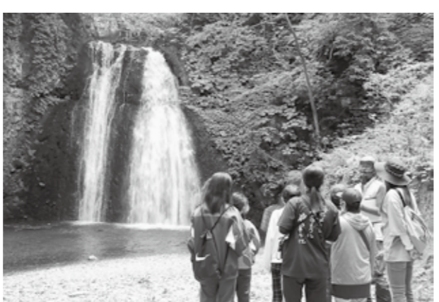
親子でジオについて学びました

9月4日、八森小学校で八峰白神ジオパークのジオサイトを巡る親子ジオが開催され全校児童および保護者が参加しました。 ジオサイトとは、科学的に重要な地質・地形やそれに関連する自然・文化・歴史が観察できる場所であり、保全しながら教育やツーリズムに活用するためにジオパークが設定する地域の見どころのことです。 当日は、海岸線、留山、三十釜の3コースに分かれ、ガイドの案内を受けました。このうち、海岸線では樺漁港で500万年前に溶岩が固まってできた柱状節理や、白瀑神社で白瀑の成り立ちなどを学びました。