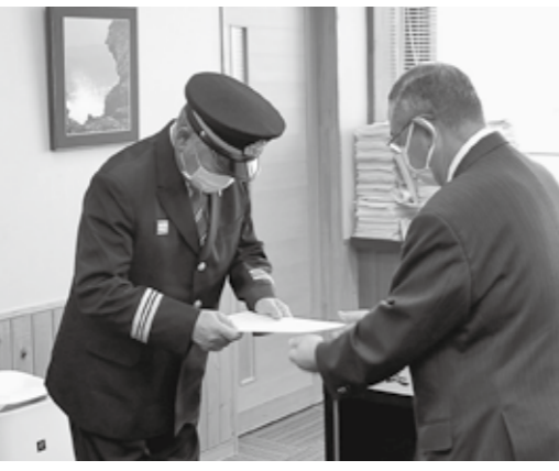
町長が団長に辞令を交付

10月1日、八峰町消防団団長と副団長に対する辞令交付式が行われました。消防団は、町民を火災などから守るため、防災意識の啓発や訓練を行っています。辞令が交付された方は次のとおりで、任期は令和5年3月31日までとなっております。