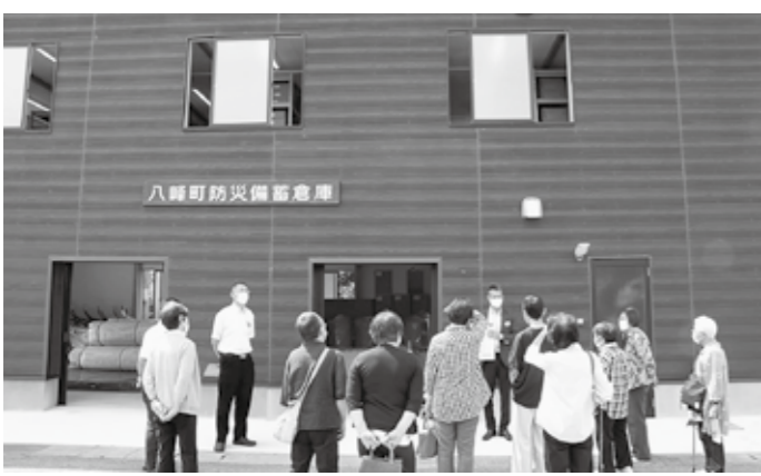
防災備蓄倉庫を見学しました