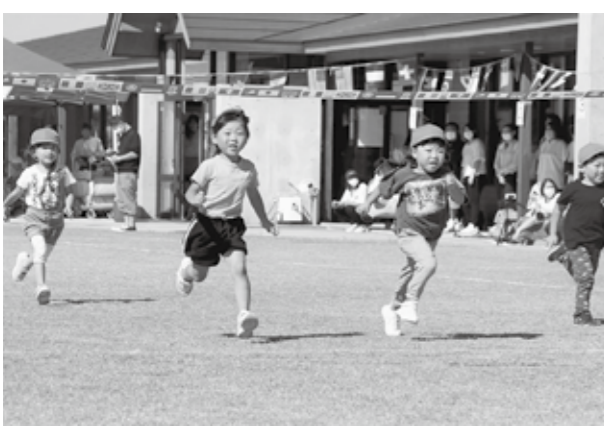
一生懸命走りきりました