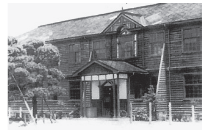
▲大正12年に建設された旧校舎

今はどこの自治体でも人口減少で悩んでいます。なんとか生まれてくる子どもの数を増やそうと、いろいろ手を尽くしているようですが、妙案は浮かばないようです。夢物語と言われるかもしれませんが、あの当時のように町の中に子ども達のにぎやかな声が再び聞こえることを願ってやみません。