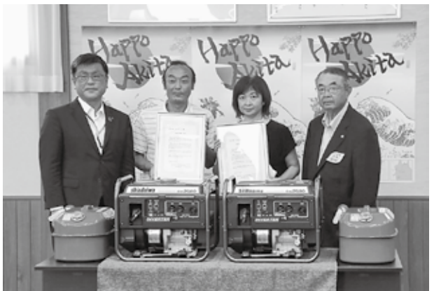
災害時等に活用させていただきます

7月30日、一般社団法人日本道路建設業協会から、道の駅「はちもり」および道の駅「みねはま」へ1台ずつ発動発電機が贈呈されました。