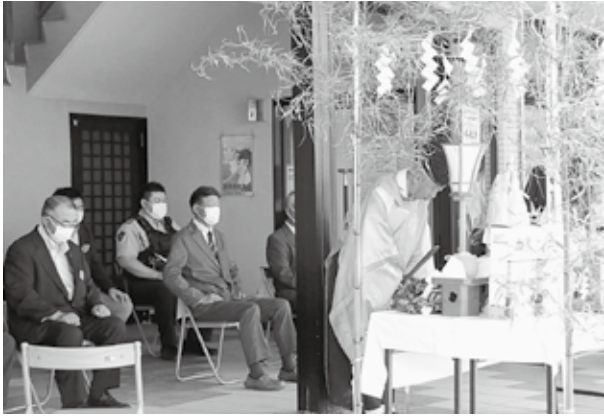
海水浴シーズンの安全を祈願しました

町長からは、海開きにあたって、「コロナの影響で他地域の海開きが中止になる中、感染対策をしっかりやることで開催できた。八峰町の大自然の魅力で多くの人が楽しんでほしい。」と挨拶がありました。