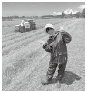
かたちから入るタイプです☆

気付かないのも寂しいです。ですので、私がSNSを使って八峰町について町内外に情報発信していくことにしました！ 私はこれまで、青森、北海道、韓国、福岡を転々としてきました。様々な地域で暮らした経験を活かし、八峰町の魅力をどんどん発見して、皆さんと共有していきたいと思っています。 また、八峰町のモノ、場所、人、仕事、制度など、様々な視点から見た八峰町について発信していきたいと考えておりますが、今後活動していく中で、私ひとりでは難しい課題も出てくるかと思えます。その際はどうか皆様お力添えの程よろしくお願ひ致します。