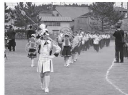
峰浜小学校 鼓笛パレード

八峰中学校も雨で6月2日(水)午後順延。グラウンド上のクラスTシャツがカラフルで、華やかで、勢いがあります。生徒会種目の「部活対抗リレー」は、いかに楽しくパフォーマンスできるかの競技(?)。会場中が笑いに包まれました。感想発表で、3年生が「まじめに、本気で取り組み、楽しんだ。クラスの団結力も高まり、完全燃焼した」。いい運動会でした。