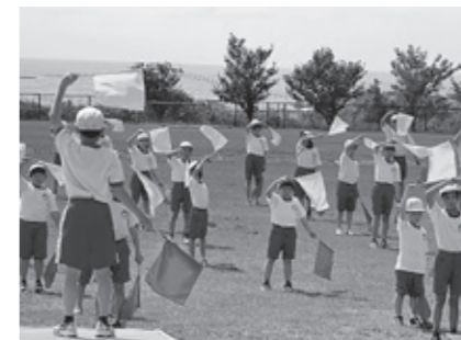
八森小学校 マスゲーム