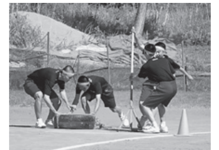
八峰中学校 部活対抗リレー