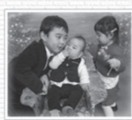
節目のお祝い 記念の一枚