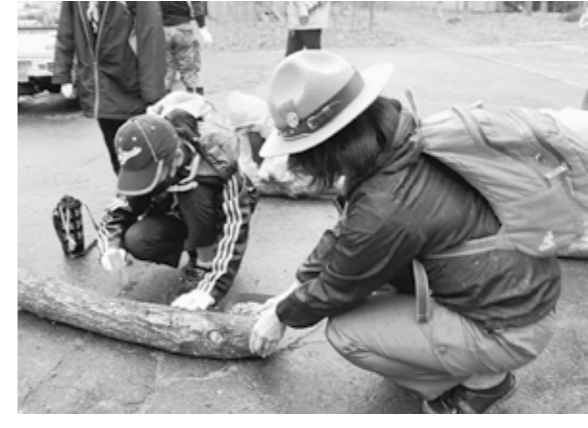
上手にコマを打ち込みました

4月17日、ぶなつこランドにおいて2年ぶりとなるきのこ植菌体験教室が開催されました。 この教室はきのこの生産過程を知ってもらおうと白神ネイチャー協会主催で毎年開かれています。当日は、町内外から親子連れを中心に合わせて約50名が参加しました。 この日準備されたホダ木は450本で、うち200本にしいたけのコマを、250本になめこのコマを打ち込みました。 参加者からは「とても楽しかった」「来年きのこが生えてくるのが楽しみ」などの感想が聞かれました。帰りには、昨年植菌されたしいたけのホダ木が一人1本プレゼントされました。