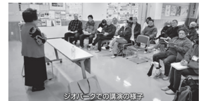
ジオパークでの講演の様子

今でも地域のつながりを大事にしたいです。大きな会場で読み聞かせするばかりでなく、5人くらいの少人数でも「話っこ聞きたい」という要望があれば足を運びたいです。最近はサロンからの依頼がずいぶん増えてきました。読み聞かせは地域の人たちと交流を深めながら楽しみたいと考えています。「笑いが一番」。皆さんに喜んでいただける様にお邪魔したいです。