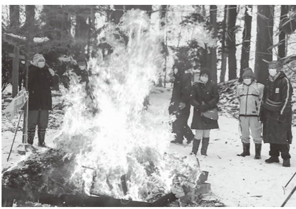
新型コロナウイルスの収束を願いました

1月10日、お正月の縁起物を燃やす小正月行事「白瀑神社どんと祭り」が同境内で行われ、正月用のしめ縄や松飾り等を持った参拝者が訪れました。 午後3時から神事が行われ、その後縁起物に火がつけられると、炎は激しく燃え上がりました。 今年も新型コロナウイルス感染防止のため、例年行われていた「青竹もち」の販売が中止となりましたが、新型コロナウイルス鎮静祈願のお札が参拝者に配られました。 参拝に訪れた方々は思い思いに、今年の家内の安全や無病息災、招福などを願いました。