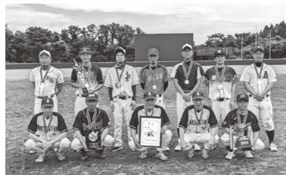
優勝：椿・椿台チーム