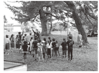
小・中連携地区奉仕活動 カッチキ台 沢目神社の周辺掃除