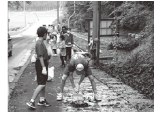
小・中連携地区奉仕活動 石川 道路のクリーンアップ