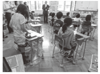
八森小 授業参観 3年生保健の授業