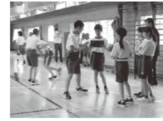
八森小 授業参観 6年生体育の授業