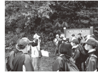
八峰中 2年生 薬師山登山