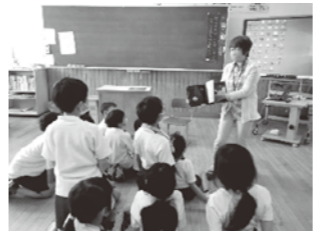
峰浜小 読み聞かせ

6月27日(月)に、町内の3つの学校の全児童・生徒が参加して、小中連携地区奉仕活動が行われます。町内の各地区で、ふだん地域の皆さんから協力してもらっている子どもたちが、地域のために力を発揮する機会になります。地域の子どもたちの頑張りを見守ってくださればありがたいです。