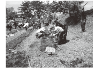
八森小 サツマイモ苗植え