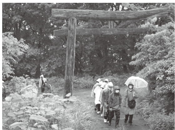
頂上にある神社を目指しました

このうち、3年生29人は、高峰山登山を行いました。この日はあいにくの雨模様となりましたが、生徒たちは、ふるさとの地形や自然、大地と暮らすのつながりについて理解を深めました。ガイドや地域の方が「高峰山は旧埴川地区のシンボリックな山で校歌にもでてきた」「昔は医療が発達して、なく、薬師神社にお参りにきていた」などと説明すると、生徒たちは興味深そうに大きく頷きながら話を聞いていました。