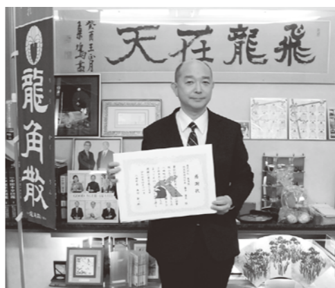
寄附金は有効活用させていただきます

3月18日、株式会社龍角散より企業版ふるさと納税として900万円の寄付を受け、町から感謝状を贈呈しました。株式会社龍角散から「栽培頂いているカミツレは、弊社ののだしに配合させて頂いています。八峰町産カミツレによりまして、従来の海外産から100%国内生薬に転換できました。これに続いて、いよいよキキョウの栽培が本格化してきましたことを大変喜んでおります。次の国産生薬への転換に向けて、引き続きご尽力をお願いするとともに大いに期待しています。」とメッセージをいただきました。町では、生薬栽培推進事業を通じて、生薬調整乾燥作業における雇用の創出や、生薬規格外品を活用した食品等により、農家の収入増加等を推進しています。