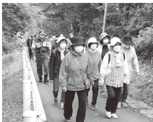
高台へ避難しました

この日は午前7時から津波避難訓練が行われ、住民は消防団の避難誘導に従い、避難路の確認をしながら高台へ避難しました。続けて消防団・消防署による火災防ぎ訓練が行われました。自らの地域は自らで守るという心構えで、過去の甚大な被害があったという記憶を風化させることなく、普段から防災の意識を高めましょう。