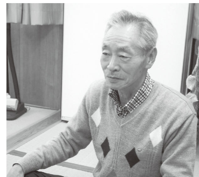
話をしてくれた人