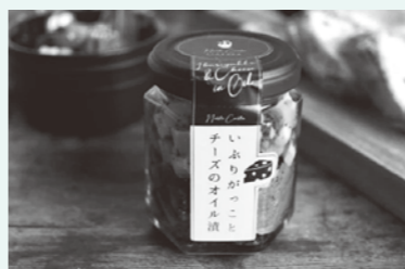
いぶりがっことチーズの オイル漬3個セット