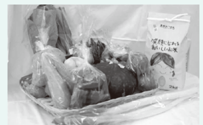
旬の野菜詰め合わせ& あきたこまち新米2kg