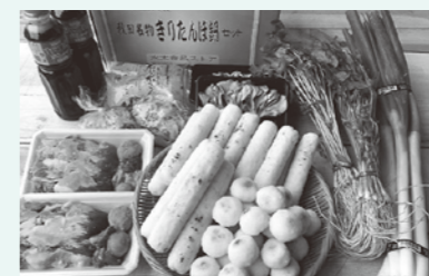
新鮮食材りたんぼ・ 焼きだまご鍋セット(12人前)