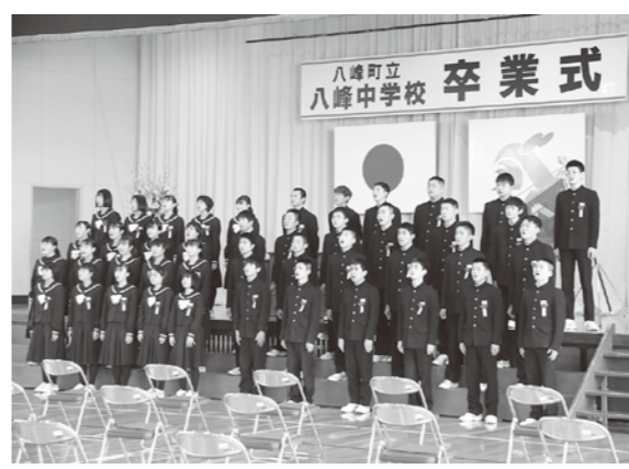
感謝と希望の気持ちを胸に巣立ちました

3月12日は八峰中学校で、同15日は八森小学校と峰浜小学校で卒業式が行われました。 このうち、八森小学校では、卒業生一人ひとりが卒業証書を八代校長から受け取りました。また、卒業生から旅立ちの言葉として、お父さん、お母さんへの感謝の言葉が伝えられました。 八峰中学校では、43名の生徒たちが卒業しました。菊地校長は「これから的人生、先が見通せなかつたり、イレギュラーなことがあると想定してはください。そのことから目を背けてはいけません。現実をしっかりと受け止め自分なりの意思や考えで行動できる強さを発揮してほしいと願っています。」と卒業生に励ましの言葉を送りました。