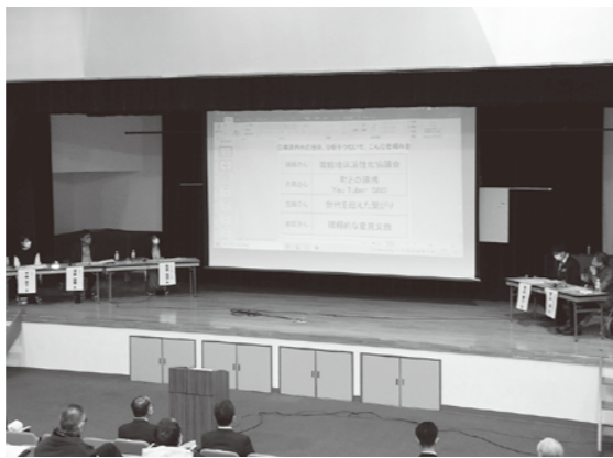
定住に向けた取組を報告しました

3月6日、ファガスにてコミュニティ生活圏形成事業の八峰町報告会を開催しました。 コミュニティ生活圏形成事業とは、人口減少や少子高齢化が進む中、複数の集落による新たな生活圏の形成を図る取り組みで、令和3年度に岩館地区をモデル地区として、住民によるワークショップを行いました。 報告会当日は、約50人が参加し、岩館住民による成果報告やパネルディスカッションを行い、様々な世代で交流できる施設や機能が必要などの意見が出ました。