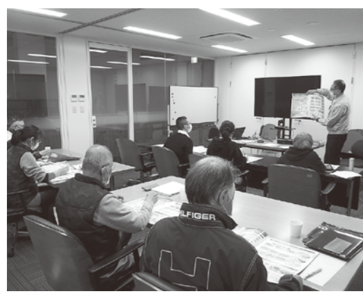
ジオガイドの防災知識の向上を図りました

3月26日、八峰町役場にて、八峰白神ジオパーク推進協議会主催のハザードマップ講習会が行われました。 この日は、総務課防災まちづくり室職員を講師に迎えて行われ、ジオガイドの会員12名のうち6名が参加しました。 「地球（ジオ）」は、豊かな恵みを与えてくれる一方で、ときに地震など深刻な災害をもたらします。災害から身を守るためには、自然のメカニズムを知り、ハザードマップや避難経路を確認することが大切です。 ジオパークを伝える役割のあるジオガイドのみならず、八峰町のハザードマップについて理解を深めるとともに、お客様へ防災を伝えること、有事の際の行動等を再確認しました。