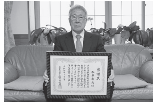
長年の功績に感謝状が贈られました

【3回目分】 緑色の封筒で送付するA4サイズ白色の用紙が接種済証です。接種後は大切に保管してください。