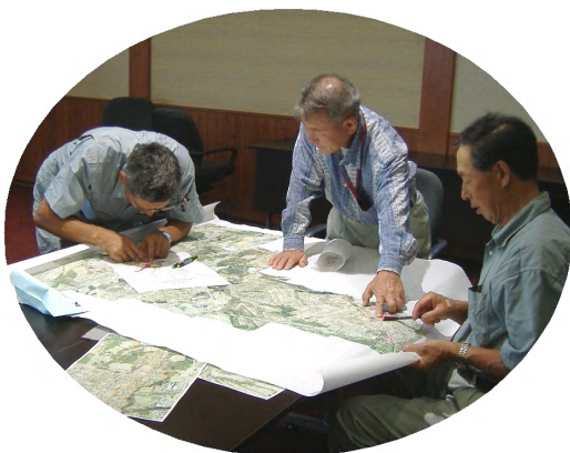
班別に受け持ち区域を図面で確認 いざ出発

今回は 埴川地区を重点地域 に設定。同地区を6ブロックに分け、1班3名の6班編成で巡回して、農地が適正に利用されているかどうかを調査しました。