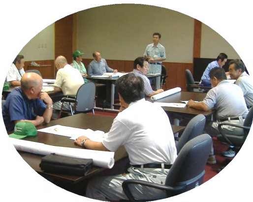
委員総出の調査 出発前に打ち合わせを行う