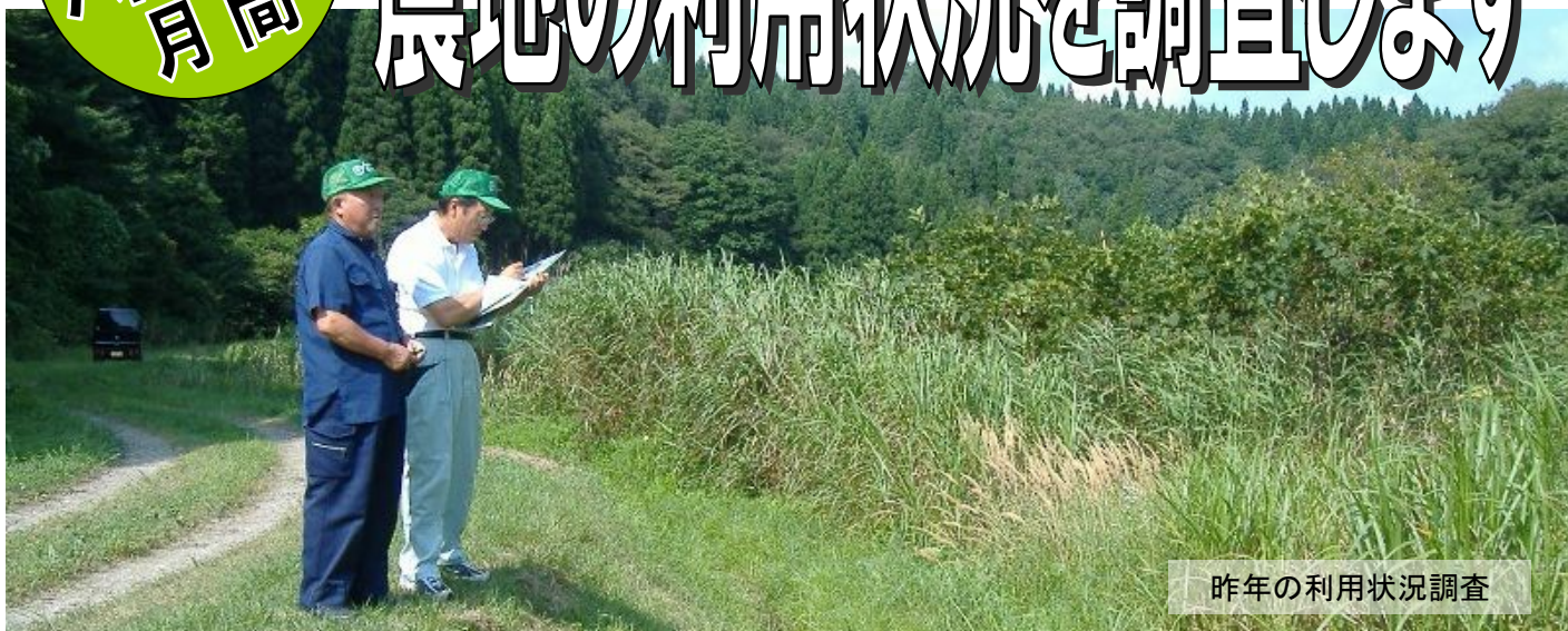
昨年の利用状況調査

○…農業委員会では昨年に引き続き、今年も「 農地利用状況調査 」を行います。 遊休農地 は病害虫の発生など、近隣の農地等に悪影響を及ぼすことがあります。農地をお持ちの方は、ぜひ 適正な管理 をお願いします。