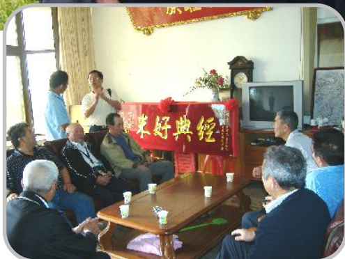
▲農家から説明を受ける農業委員一行