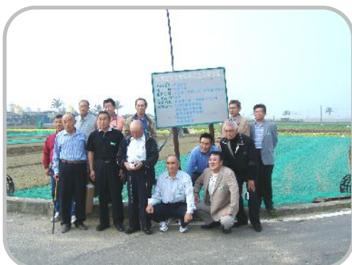
▲高雄市の「蔬菜生産事業区」にて