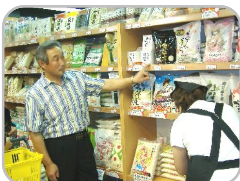
▲台北SOGOで国産米の販売状況を視察

○…11月13～17日、私たち農業委員は台湾へ研修に赴きました。目的は現地台湾における農業事情の視察。費用はすべて自己負担です。